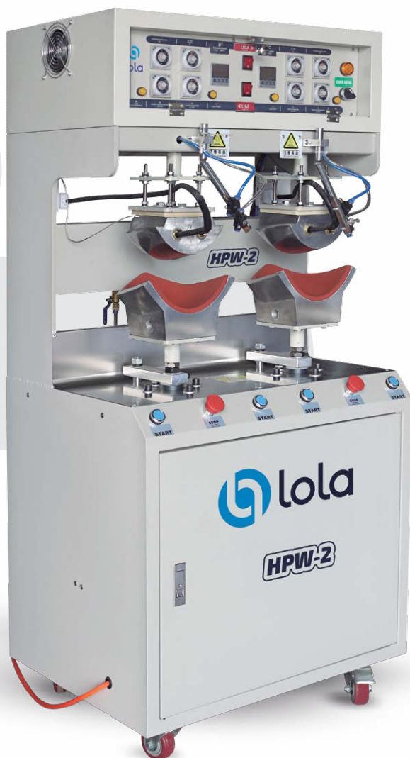
*Máquinas podem receber atualizações para novos modelos.